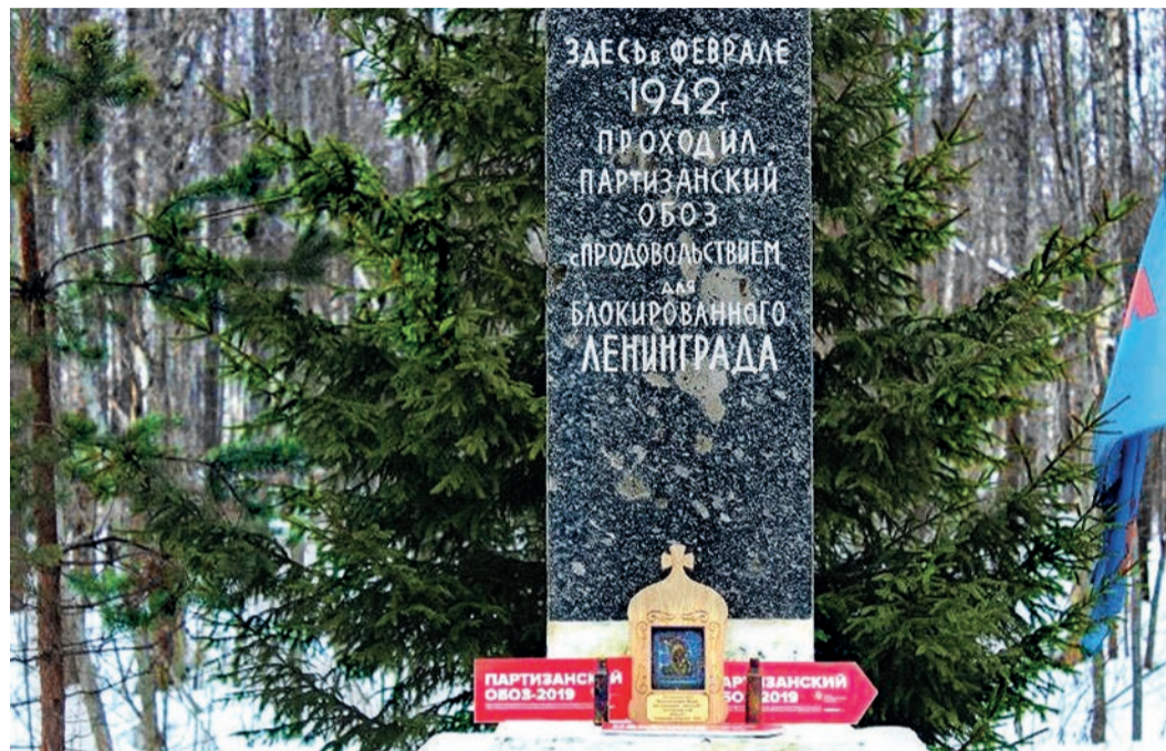
Обелиск в Нивках в память о партизанском обозе в помощь ленинградцам

В этом году наша страна празднует 75-летие Великой Победы. Это общее дело, в которое наши родные и близкие вложили свою душу, а некоторые — и свою жизнь. Все они совершили безмерный подвиг во имя Родины, во имя нашего будущего. Память об этом живет в воспоминаниях, передаваемых от дедов к внукам, в пожелтевших фотографиях, в морщинках у глаз, в тихой гордости и в знании нашей общей истории. Пока мы помним и благодарим ветеранов войны за их мужество — они будут жить в наших сердцах и в сердцах наших детей. К юбилею Победы мы открываем серию материалов о тех, кто воевал в годы Великой Отечественной войны, подготовленных по рассказам старшего поколения энергетиков или через призму воспоминаний работников филиалов нашей большой Компании.