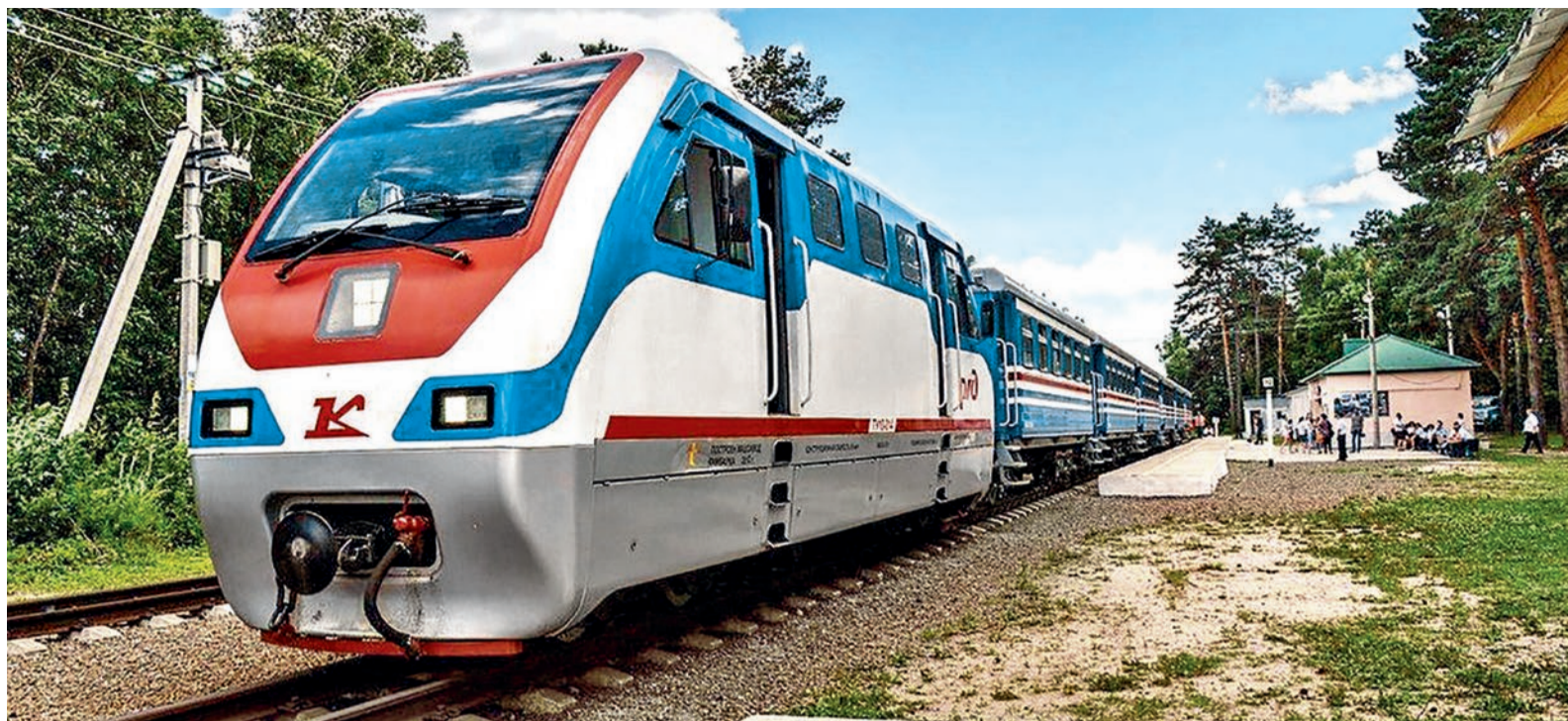
Одна из главных достопримечательностей Свободного — Детская железная дорога. Ее особенность в том, что все работники, кроме машиниста, — дети. Дорога работает всего три месяца в году, исключительно летом

гектар»: она дает право бесплатно получить землю в регионе и в дальнейшем оформить ее в собственность. Проект получил широкое распространение в 2017 году и за прошедшее время не потерял своей актуальности. Только в 2019 году им воспользовались более 11,5 тыс. человек, а суммарная площадь предоставленной за год земли составила 7,1 тыс. га.