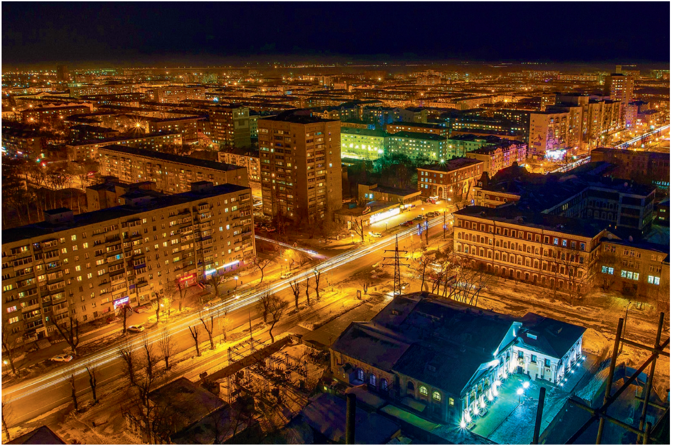
Благовещенск — административный центр Амурской области

В Амурской области полным ходом ведутся работы по строительству Свободненской ТЭС — нового филиала ПАО «ОГК-2» — самого восточного из существующих на сегодня. На площадке будущей станции идет монтаж основного и вспомогательного оборудования, возводятся корпуса зданий и производственных помещений, строятся необходимые коммуникации. А в скором времени появятся и первые сотрудники! Предлагаем познакомиться с регионом, где будет располагаться новый энергетический объект, а также с возможностями, которые представляются тем, кто готов стать частью команды «ОГК-2» на Дальнем Востоке.