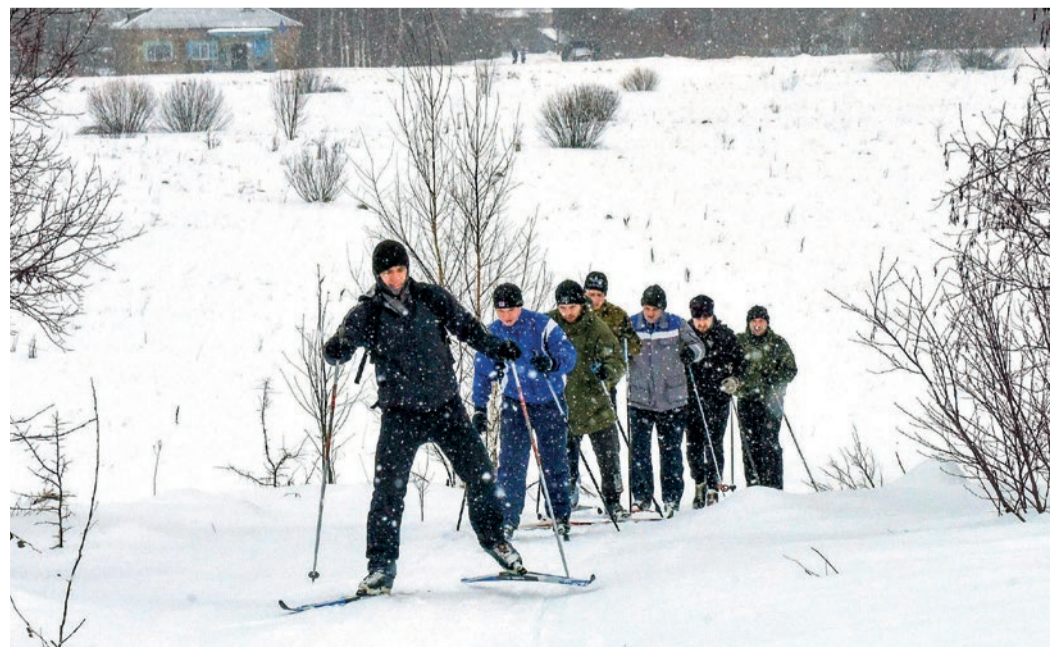
Лыжный десант по пути обоза. 2019 год