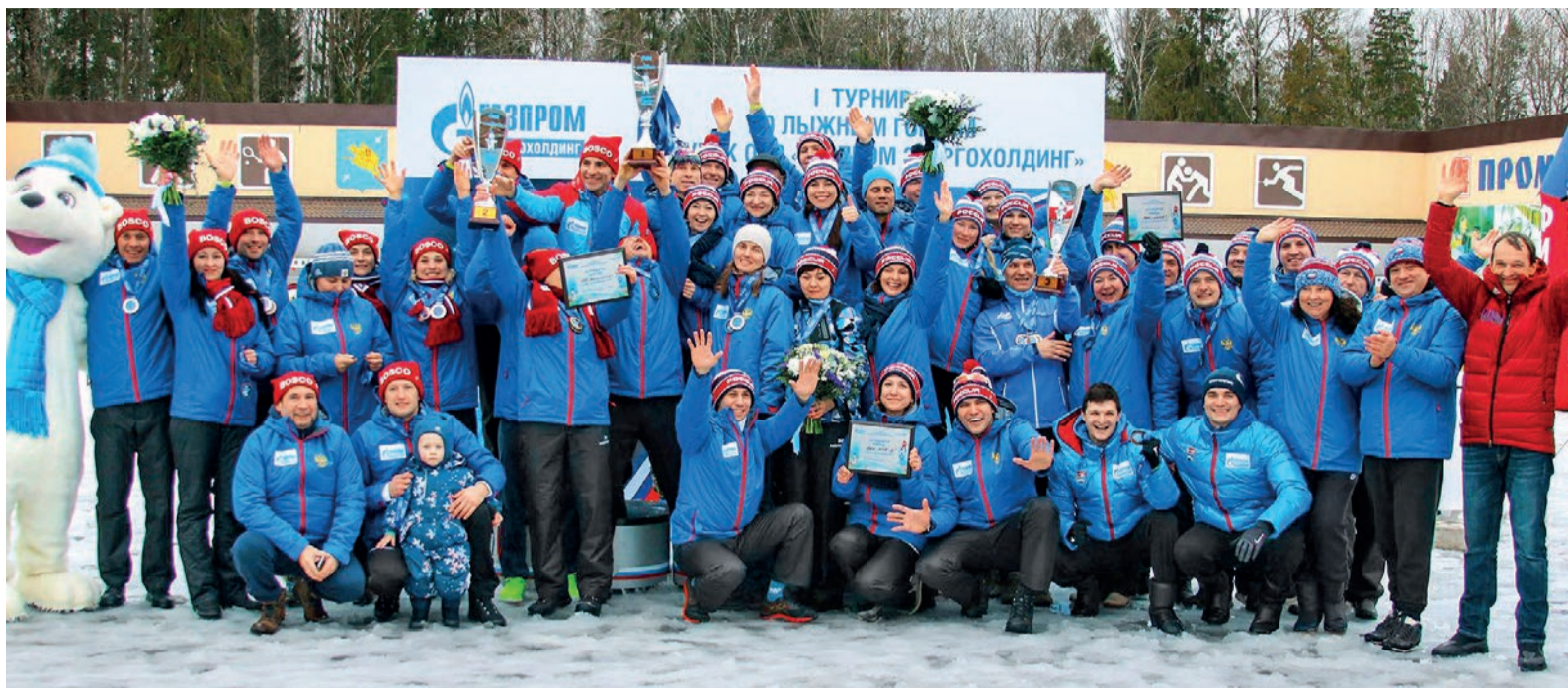
Пьедестал почета. В турнире приняли участие более 50 сотрудников компаний ПАО «Мосэнерго», ПАО «МОЭК» и ПАО «ОГК-2»

В ходе церемонии закрытия соревнований первый заместитель генерального