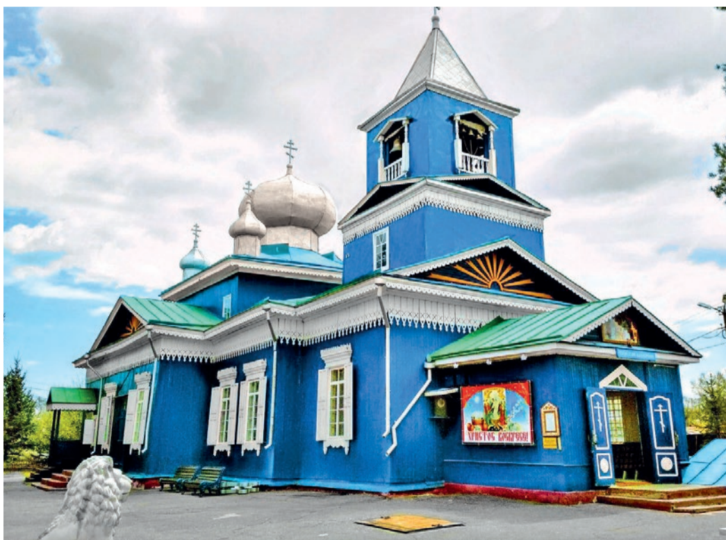
Свято-Никольский храм — ровесник города Свободного. Святыня носит имя Николая Чудотворца

ПАО «ОГК-2» ПРЕДЛАГАЕТ ДЛЯ ВСЕХ РАБОТНИКОВ СВОБОДНЕНСКОЙ ТЭС ПАКЕТ СОЦИАЛЬНЫХ ГАРАНТИЙ И ЛЬГОТ